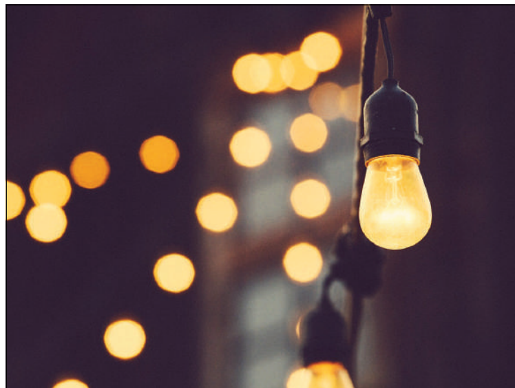
Pequenos hábitos podem impactar na tarifa de energia elétrica

dro Pugliese, da Help Reforma e Construção, também ensina alguns truques simples que vão ajudar a diminuir a conta de luz.