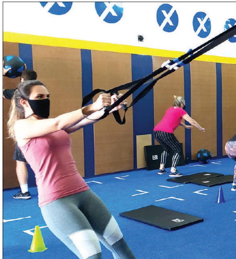
Na Cross Experience, atividades mesclam exercícios aeróbicos e de força para garantir mais resultados e qualidade de vida

Com todos os cuidados contra a Covid-19, a Cross Experience São Bernardo promove aulas dinâmicas, motivacionais e com segurança, sempre acompanhadas de um profissional habilitado de Educação Física.