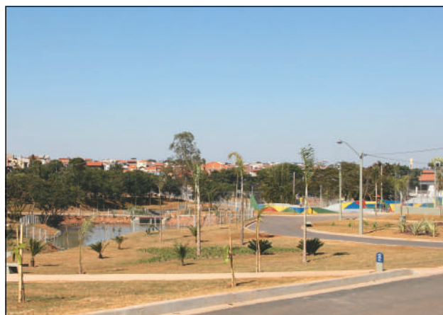
Parque Luciano do Valle, localizado na Vila União

A Prefeitura de Campinas ampliou o horário de funcionamento de quatro parques públicos: Lagoa do Taquaral, Parque Dom Bosco, Parque Linear do Capivari e o Parque Luciano do Valle funcionarão das 6 às 21 horas. Os demais parques e os bosques continuarão abertos das 6 às 18 horas. Em todos os locais, os visitantes devem usar máscara e seguir as demais recomendações sanitárias de evitar aglomerações, manter distanciamento e fazer uso do álcool em gel.