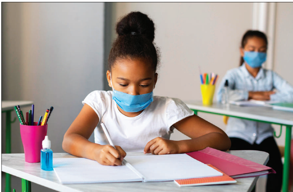
Aulas presenciais em escolas das redes municipal, estadual e particular estão autorizadas com restrições

O espaços municipais, como teatros, museus, bibliotecas, equipamentos esportivos, parques passam a funcionar se-