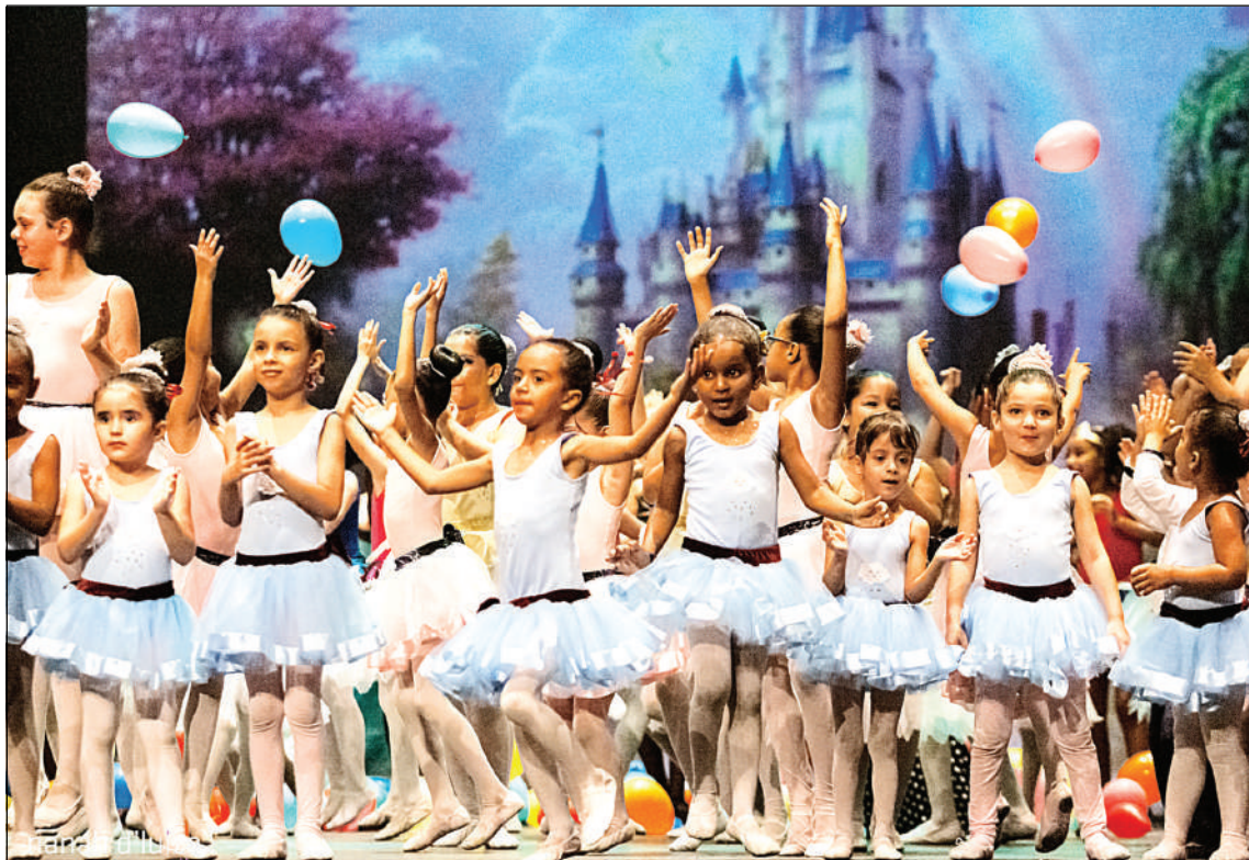
Espectáculo de final de ano, quando todos alunos e professores sobem ao palco