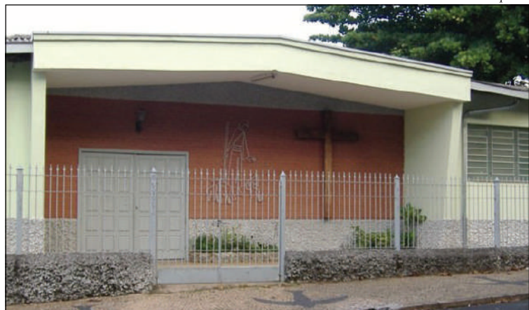
Paróquia Bom Pastor retoma atividades