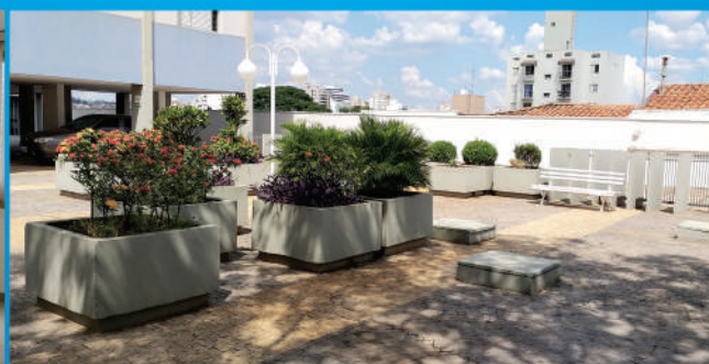
Condomínio tranquilo, barato e muito bem cuidado