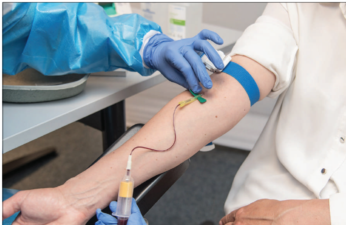
Basta coletar uma amostra de 10 ml de sangue para se cadastrar no Redome como doador