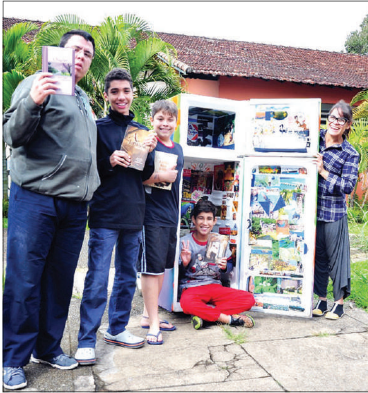
Geladeiras repaginadas oferecem livros em centros de saúde e estimulam na população o hábito da leitura

"Acho que a ideia é seguir e ampliar o caminho para o livro, não à volta aos livros. Vejo que os livros infantis e juvenis, como Harry Potter, são muito queridos e começaram a ser bem procurados. Então, não vejo o livro impresso rivalizan-